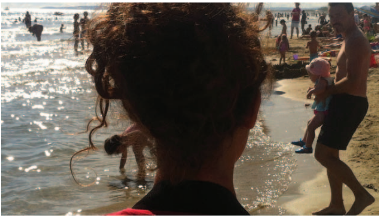
Add a Title ARRI ALEXA Plus 4.3 1.78 (16/9) Cooke S4i