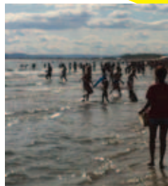
Add a Title ARRI ALEXA Plus 4.3 1.78 (16/9) Cooke S4i