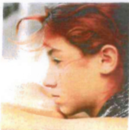
Leur jeunesse, de David Roux : une enfance rom.